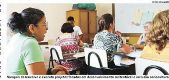
Nanquin desenvolve e executa projetos focados em desenvolvimento sustentável e inclusão sociocultural

social. Oferece oficinas de costura e artesanato, para que as atendidas possam ter sua autoestima renovada, gerando o empreendedorismo cultural. Geração Audiovisual: curso de produção para cinema direcionado a alunos da Rede Pública de Ensino. Com ferramentas de mídia aplicadas em cinema, ensina como filmar, atuar e improvisar, auxiliando a perda da timidez, ajudando na aprendizagem e na