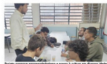
Projeto promove empreendedorismo e acesso à cultura em diversas idades

liando a desenvolverem e executarem a sua arte, através de propostas incentivadas. Hoje, a Nanquin desenvolve e executa projetos focados em diferentes objetivos de desenvolvimento sustentável e inclusão sociocultural, atendendo diversas faixas etárias e gêneros, promovendo o empreendedorismo e acesso à arte e cultura. Tear dos Saberes: projeto oferecido para mulheres de 16 a 60 anos vítimas de violências e em vulnerabilidade