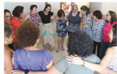
As participantes são mulheres vulneráveis do Jardim Morada do Sol

tesanato. Agora está lançando uma oficina de Alfabetização para pessoas idosas, que é aberta para adultos que queiram aprender a ler e escrever. As aulas serão gratuitas, todas as Quartas das 09 às 11. Para se inscrever basta entrar em contato pelo telefone: (19) 98121-6090. Conheça mais sobre o Projeto e o Instituto através das redes sociais, no Instagram: @nanquinculturaarte ou pelo telefone (19) 98121-6090.