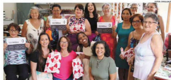
A Ação aconteceu na segunda-feira (11) e fez parte do calendário de Eventos do Instituto

A ação contou com um dia de beleza, com corte, escova, massagem e palestras sobre autoestima