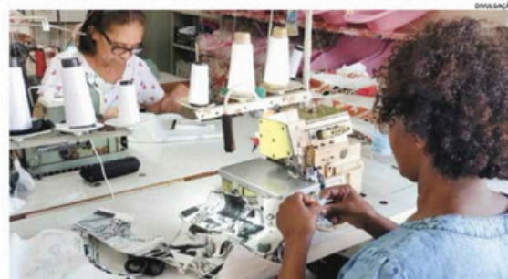
Oficinas gratuitas de Corte e Costura tem o objetivo de empoderar as mulheres da comunidade

Com o incentivo da empresa Irani Papel e Embalagem, uma das principais indústrias de papel e embalagens sustentáveis do Brasil, a partir do dia 28 de Maio, a Nanquin Cultura e Arte estará oferecendo oficinas de costura, Padronagem, Corte de tecido, Costura à mão, Montagem de peças, Acabamento, Ajustes e reparos. As atividades ocorrerão regularmente às Terças, Quartas e Quintas, das 09h às 11h, na Rua José da Silva Maciel, número 1020, no